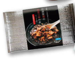
▲ 万能たれ等のオリジナル商品。